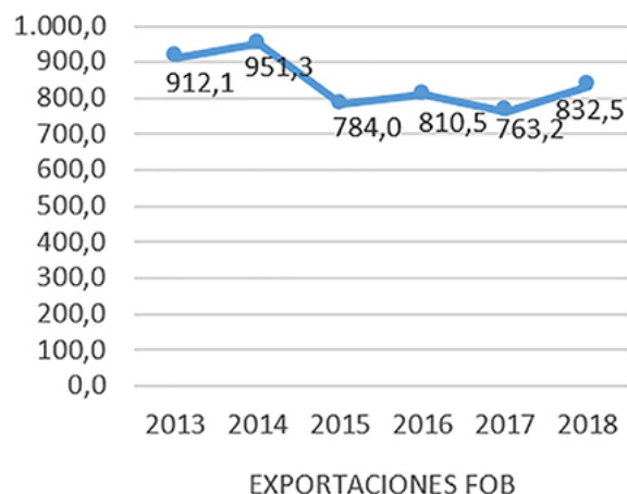
Gráfico 1: Exportaciones FOB anuales de Ecuador a Colombia (millones de dólares).

Fuente: (Banco Central del Ecuador, 2019) Elaborado: Por autores