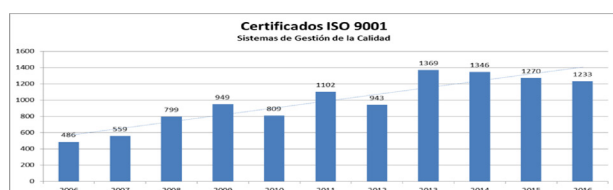
Figura 2: Histograma de certificaciones en Ecuador Fuente: (Servicio de Acreditación Ecuatoriano, 2016) Elaborado: Autores

Quizás la normativa más usada en la gestión empresarial son las normas de Gestión de la Calidad ISO 9001: 2015 que tiene sus antecedentes en 1987 cuando se publicó su primera versión. De acuerdo a la ISO 9001:2015 la adopción de un sistema de gestión de la calidad se debe considerar como “una decisión estratégica para una organización que le puede ayudar a mejorar su desempeño global y proporcionar una base sólida para las iniciativas de desarrollo sostenible”(María Alzate-Ibañez, 2017, pag 2577). Esta norma se le otorgó carácter de ley en varios países e incentivó los servicios de consultoría. Por su complejidad generalmente se necesita de un asesoramiento externo. En la figura 2 se muestra un análisis de la cantidad de empresas certificadas con ISO 9001 entre los años 2006 hasta el 2016.